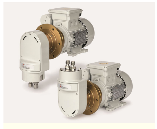
Messgaspumpe P2.2 O2 Atex

Da beim Elektrolyseverfahren keine partikulären Verschmutzungen im Messgas zu erwarten sind, reichen einfache Entnahmestellen, vorzugsweise an jedem Ausgang eines Moduls. Aus diesen wird das Messgas von einer speziellen Messgaspumpe, welche auch in der Lage ist eventuell auftretendes Kondensat zu fördern, angesaugt und unter leichtem Überdruck einem Messgaskühler zugeführt. Bei der Bemessung der erforderlichen Fördermengen ist auf der H 2 Seite die geringere Dichte von Wasserstoff zu berücksichtigen damit vor dem Analysator auf den korrekten Durchfluss eingedrosselt werden kann.